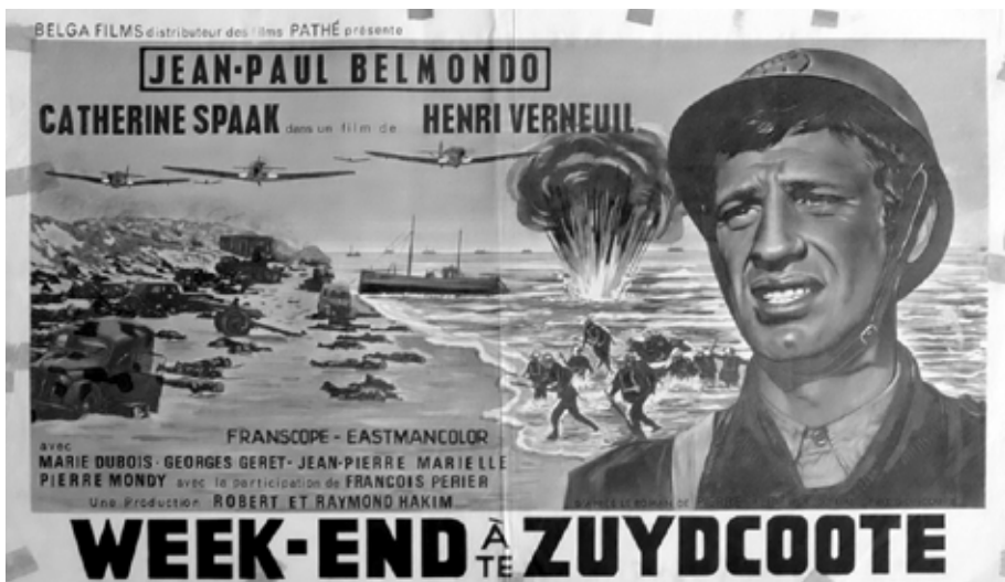
Henri Verneuil, Week-end à Zuydcoote (1964)

Over de Tweede Wereldoorlog kan je dan weer twee fictiefilms aanstippen: Week-end à Zuydcoote (uit 1964, van Henri Verneuil met opnieuw Belmondo) en het recente En mai, fais ce qu'il te plait (2015) van Christian Carion. Focust de eerste in ouderwetse Hollywoodstijl op de bombardementen van Franse en vooral Britse soldaten die op het strand van Duinkerke wachten op evacuatie naar Engeland, de tweede is een verzorgd maar nogal didactisch melodrama over de exodus van de inwoners van een dorpje in Pas-de-Calais op het moment dat de Duitsers Frankrijk binnenvallen. Al moet er bij gezegd worden dat Verneuls film een van de weinige uit die periode is die niet de klemtoon legt op de verdienste van het verzet of de glorie van de overwinning maar op de grimme nederlaag en het grote verlies van mensenlevens.