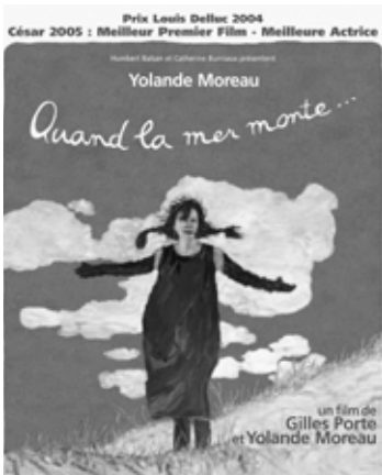
Yolande Moreau en Gilles Porte, Quand la mer monte (2004)

Dumont, die met P'tit Quinquin , zijn eerste stap zet in het komische genre, zegt over de aanpak van Boon en die van hemzelf: 'Boon zet alles dik in de verf: hij drijft de spot met de clichés over de Nord en hij doet dat op een nogal juiste manier. Ik speel niet met de karikatuur. P'tit Quinquin heeft niets te maken met de werkelijkheid. Zelfs al maak