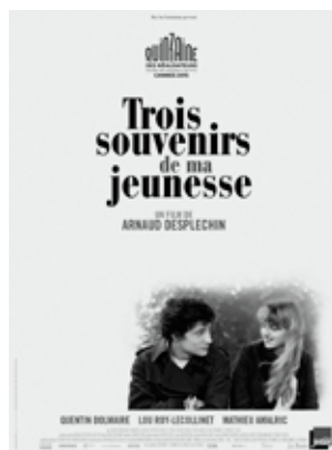
Arnaud Desplechin, Trois souvenirs de ma jeunesse (2015)