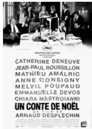
Erick Zonca, La vie rêvée des anges (1998) Philippe Faucon, La désintégration (2010) Arnaud Desplechin, Un conte de Noël (2008)