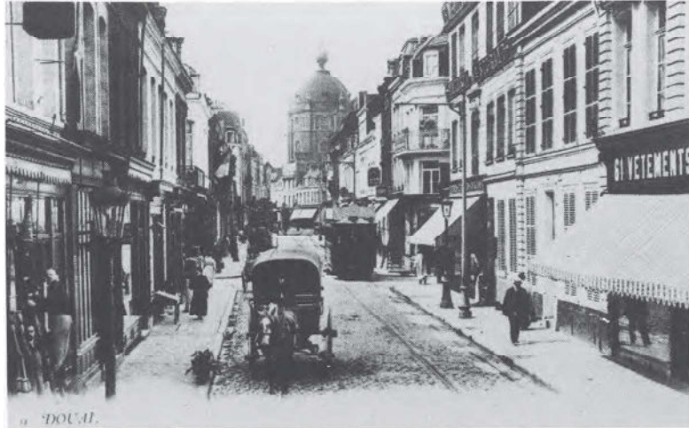
Douai: la Rue Saint-Jacques, à la fin du XIX e siècle.

Balzac, «le type des modestes maisons que se construisit la bourgeoisie du Moyen Age», en Flandre.