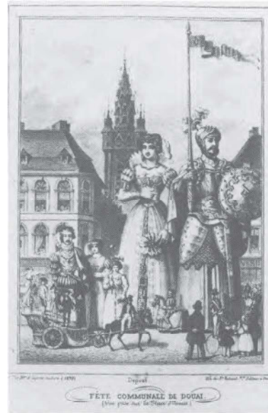
Fête communale de Douai (1839).

La Semaine , publié le 4 octobre 1846, affirmait: «Les Miéris et les Metz u n'ont pas fait de plus belle peinture flamande». Samuel-Henry Berthoud, auteur de nombreuses études sur la peinture flamande et hollandaise, le pensait aussi. Dans le Musée des Familles , en octobre 1841, il écrit: