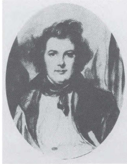
Portrait de Balzac d'après Achille Deveria, vers 1833.

ves». Mais qu'est-ce que la Flandre pour Balzac? Une rature du manuscrit de La Recherche de l'Absolu , conservé à la Collection Spoelberch de Lovenjoul, à Chantilly, atteste qu'il avait spontanément parlé des «trois Flandres», se conformant ainsi à la distribution traditionnelle des historiens entre, d'une part, en Belgique, Flandre occidentale et Flandre orientale, et, d'autre part, en France, Flandre française. Mais il effaça aussitôt ces mots et ne parla plus que de «la Flandre». Comme tous les voyageurs français du XVIII e siècle et même de son temps, il confond visiblement dans une même admiration le pays de Rubens et celui de Rembrandt, les maîtres flamands et hollandais, résumant dans ce nom de «Flandre» l'ensemble des anciennes provinces des Pays-Bas. Avec lui, la Flandre prend en outre une autre dimension et joue un rôle comparable à celui de l'Orient, espace homogène et clos, composé certes d'éléments hétérogènes, mais rassemblés par un puissant facteur d'unité. A l'Orient, espace de l'infini et expression de l'absolu, répond dans La Comédie humaine la Flandre, espace du fini. Variée dans sa géographie et son histoire, mais solidement unifiée, elle fut le «magasin général de l'Europe, jusqu'au moment où la