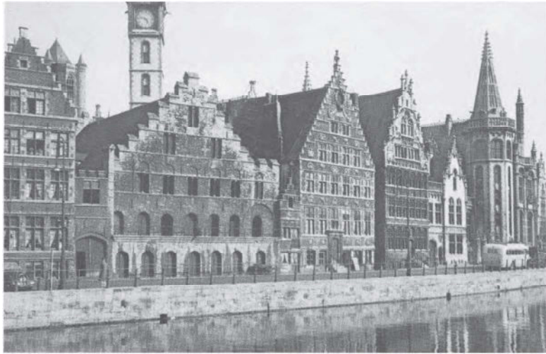
Gand: Quai aux Herbes.

secrètement, sous la protection de la France, sa femme, ses enfants et ses richesses». Dans la maison typiquement flamande, qui fut bâtie dans la seconde moitié du XVI e siècle, vivait donc, dans les premières années du XIX e siècle, Balthazar Claës, digne héritier de la fortune patrimoniale, homme fort respectueux des traditions ancestrales. Mais, en 1809, saisi par le démon de la chimie, qu'il avait étudiée, pendant sa jeunesse, dans le laboratoire du grand Lavoisier, Claës, en quelques années, dissipe en expériences les immenses richesses patiemment accumulées par six générations. Totalement absorbé par la recherche de l'Absolu, il n'est plus ni père ni époux ni citoyen de Douai, et sa femme meurt de chagrin. Deux fois ruiné, vaincu par la Science, Claës, en 1832, meurt désespéré, tandis que sa fille aînée, Marguerite, devenue l'âme de la maison à la mort de sa mère, rend à la maison Claës «une splendeur moderne qui devait écarter toute idée de décadence». Quelle place occupent, dans cette tragique histoire, les réalités douaisiennes? On ne peut nier assurément l'authenticité des noms de lieux; la Scarpe est là, ainsi que la promenade Saint-Jacques et la rue de Paris, assez proche de l'église Saint-Pierre où se rend Mme Claës pour assister à la messe ou aux vêpres,