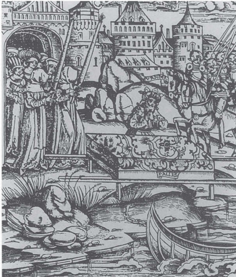
Begijnen openen een begrafenisstoet, begin 16de eeuw. (Uit: J.-Cl. Schmitt, Mort d'une hérésie , Parijs, 1978, pl. 1)

Dowaai, of een commerciële activiteit ontplooiden, bleven onderworpen aan de stedelijke fiscaliteit (38). De begijnen beschikten over een gewone rechtspersoonlijkheid, oefenden het volledige eigendomsrecht over hun bezittingen uit (39), en verschenen als burgers voor de schepenen.