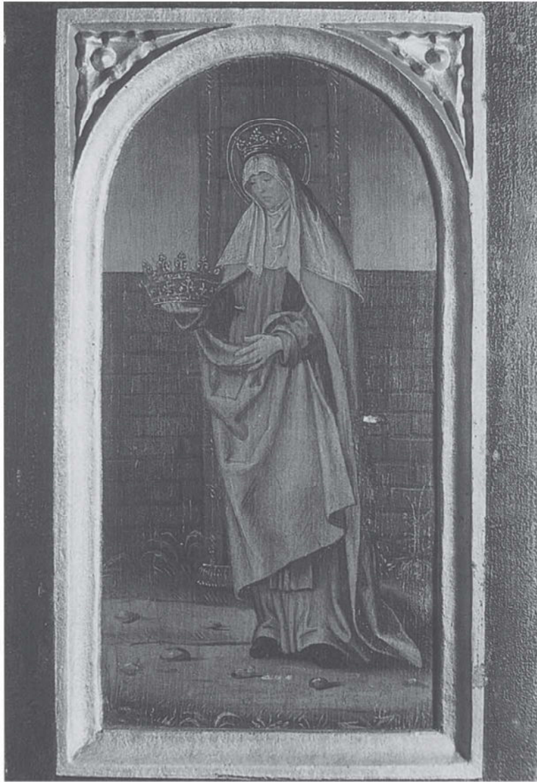
De heilige Elisabeth, patrones van het begijnhof van Champfleury. Gent, Begijnhof van Sint-Amansberg, ca. 1500