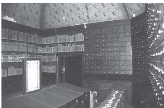
Gemeentehuis van Dowaii (Douai), zaal van de oude archieven, juli 1999.

Toen in het midden van de vijftiende eeuw twee huizen naast het stadhuis afbrandden, maakten de schepenen zich zorgen over de veiligheid van het archief.