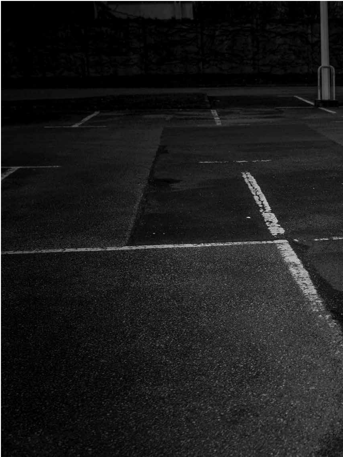
Virginie Besengez, Obsession n° 2 , 2015