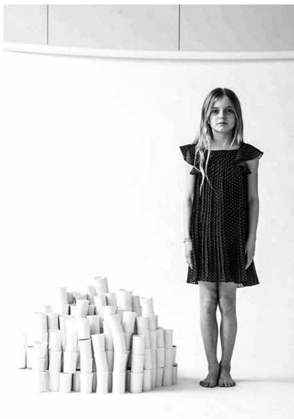
Virginie Besengez, Votre poids en bols , 2014

L'univers de la céramique a son propre circuit avec ses biennales et ses antennes dans celui du design. En ce qui concerne Virginie Besengez, elle participe depuis 2001, donc depuis ses premiers pas dans la carrière, à la Biennale de la céramique à Andenne. À peine un an plus tard, elle s'est trouvée