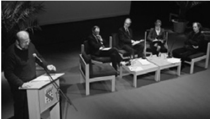
Jacques Dufourmont leidt de werkgroep “Taal en onderwijs” in

Piet Van Avermaet ziet het leren van een taal als een continu proces dat eigenlijk nooit eindigt. Een taal leert men niet alleen in de formele klassensituatie maar ook in een informele omgeving en het best niet onder dwang. Een klassensituatie waarin anderstalige kinderen nooit hun moedertaal mogen gebruiken is niet aan te raden. Af en toe een functioneel gebruik toestaan van de moedertaal is op termijn heel nuttig. De leerling zal zich zo minder afzetten tegen de taal die hij/zij moet leren en zal een beter zelfbeeld hebben. Men zou zelfs kunnen stellen dat een kind beter eerst goed zijn moedertaal doorgrondt en beheerst voordat het intensief een andere taal leert. Maar Van Avermaet voegde daar onmiddellijk aan toe dat dit praktisch nauwelijks haalbaar is.