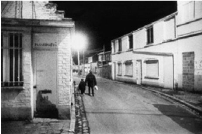
Menen (B) – Halewijn (F): de Barakken