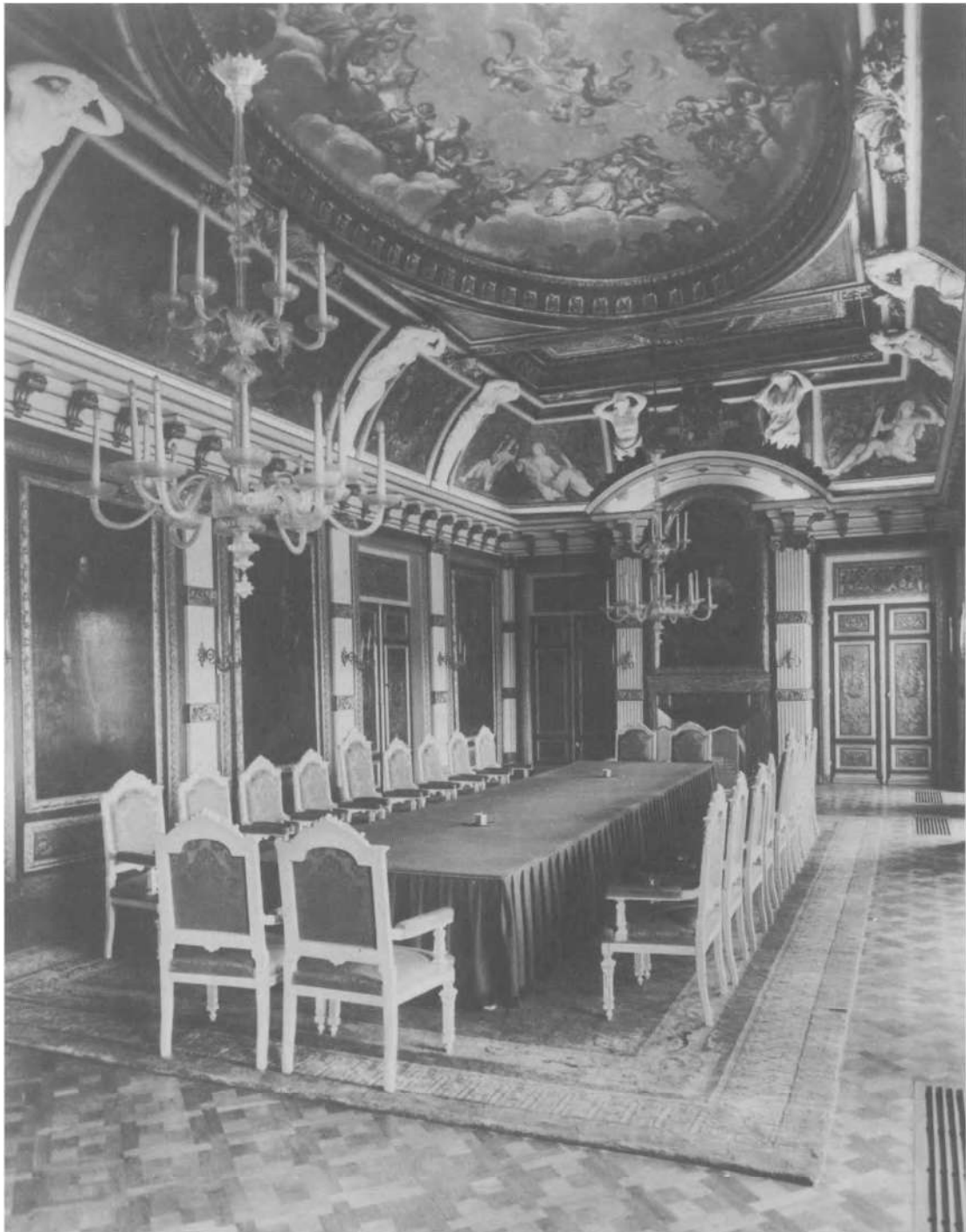
La Haye - Salle de Trêves, Binnenhof.