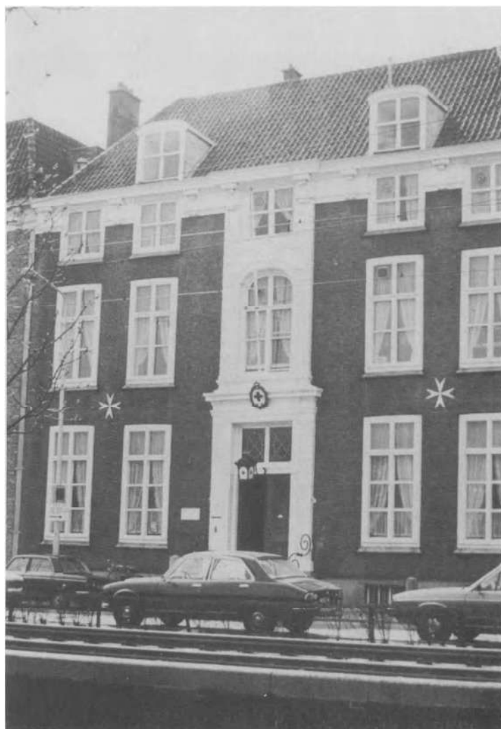
Prinsessegracht 27, l'actuel siège de la Croix Rouge.