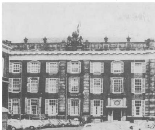
Logement des délégués d'Amsterdam, Plein, La Haye.