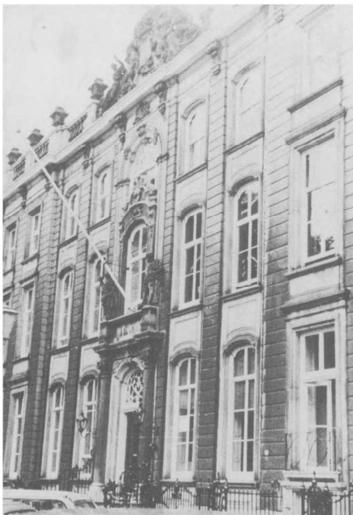
Maison Huguetan, l'ancienne Bibliothèque Royale, Lange Voorhout 36, La Haye.