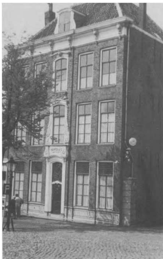
Oude Haven 55, Zierikzee.

Il est toujours vrai qu'à cette époque les constructeurs travaillent d'après les ordres des propriétaires qui imposaient leur goût; l'architecte était encore très peu indépendant. Au dix-