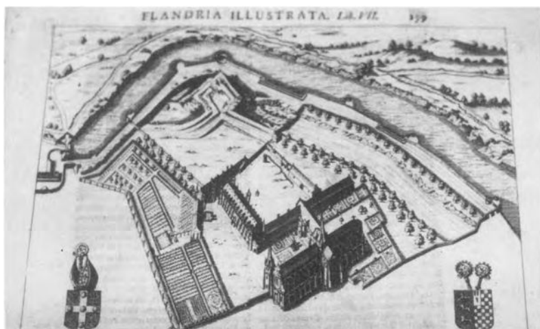
De abdij van Sint-Winoksbergen, uit Antonii Sanderi, Flandria Illustrata sive Comitatus ipsius descriptio (1732).

Heel toevallig vernemen wij, uit één van de eerste Miracula S. Winnoci , dat het landgoed (de villa) Zwevezele vroeger deel had uitgemaakt van dat domein en dat het aan een meier, Adalardus geheten, werd toevertrouwd. Omstreeks 1015, in een tijd van hongersnood, ontsnapten de lijfeigenen van Zwevezele en werden te Bonen door een zekere Mirolf aangehouden om als slaven te worden verkocht. Van Zwevezele vernemen wij een halve eeuw later niets meer: in 1067 bezat de Sint-Winoksabdij geen enkele villa meer, zoals wij verder zullen zien. In de middeleeuwen hing de vermaardheid, en dus voor een deel de stoffelijke welstand van een geestelijke communitieit af van de aanwezigheid van befaamde relikwieën. Boudewijn II zorgde daar eveneens voor. Hij liet het lichaam van een oude Schotse of Bretoense heilige, de H. Winnocus of Winok, die in de zevende eeuw te Wormhout had geleefd en daar nog steeds rustte, naar Sint-Winoksbergen overbrengen. Die plechtige overbrenging, de translatio zoals men die noemde, vond plaats op 30 december 899 (of wellicht in 900).