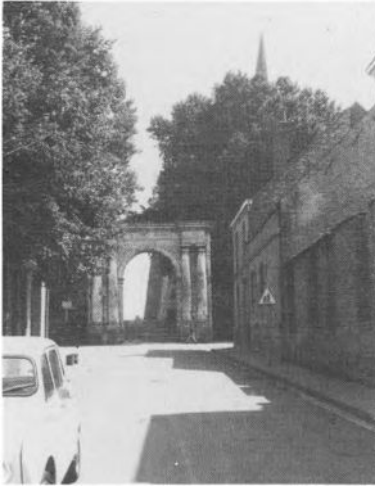
De toegangspoort tot de abdij van Sint-Winoksbergen.