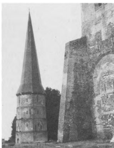
De „Piektorre” van de abdij van Sint-Winoksbergen.

Groeneberg. Informaties over graaf Boudewijn V en diens echtgenote, gravin Adela van Frankrijk, hebben we dankzij de monnik Drogo, die beide prinsen mocht benaderen en ze terloops in enkele passages van zijn werk zeer levendig schetste: de vrome en tevens nieuwsgierige gravin, zo gemakkelijk in haar gebeden verstrooid, de gevreesde en toch aarzelende graaf Boudewijn, bevreesd om met te machtige leenmannen in botsing te komen. Beide prinsen bewoonden regelmatig de kloosters van hun graafschap, vooral die zij zelf hadden helpen bouwen. In zijn laatste jaren moet Boudewijn V vaak te Sint-Winoksbergen te vinden zijn geweest. Nog kort vóór zijn dood (1 september 1067) gaf hij aan de monniken van de Sint-Winoksabdij de belangrijkste oorkonde waarover wij het reeds hebben gehad.