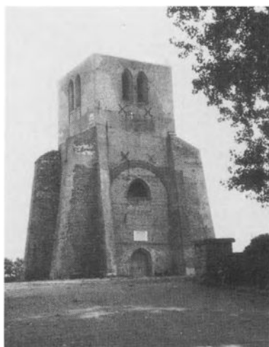
De „Blauwtorre” van de abdij van Sint-Winoksbergen.