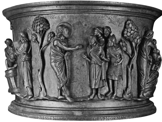
Saint Jean-Baptiste prêche dans le désert, fonts baptismaux de Notre-Dame, 1107-1118, détail, collégiale Saint-Barthélemy, Liège.