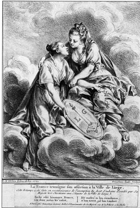
La France témoigne son affection à la ville de Liège. Estampe de Charles Nicolas Cochin gravée en 1771 par Gilles Demarteau, Bibliothèque Chiroux-Croisiers, ville de Liège.

Prusse, et redevint belge après la Première Guerre mondiale. Et il faut préciser aussi que, dans ces négociations pour fixer les limites des États suite à la Révolution belge, le Luxembourg fut également divisé en deux parties, l'une deviendrait la province belge du Luxembourg et l'autre resterait le Grand-Duché du Luxembourg, et en compensation, la Confédération germanique absorba la province du Limbourg néerlandais, converti en un duché de Limbourg.