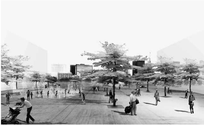
Bureau Bas Smets, espaces extérieurs du site de Tour & Taxis, Bruxelles, perspective depuis le parvis, 33 ha, 2009.

d'Ingelmunster (Flandre-Occidentale), l'espace entourant les nouvelles salles de théâtre de la compagnie des Ballets C de la B et du Muziek Lod sur le site de la Bijloke à Gand, les patios d'un centre de repos et de soins à Lommel, dans le Limbourg belge, l' Arenaplein de Tirlemont, dans le Brabant flamand, l'extension de la zone de services du Kennedypark à Courtrai ainsi que l'aménagement extérieur de Courtrai Xpo et des espaces publics de la nouvelle gare de Roeselare (Flandre-Occidentale), et le schéma directeur du site de Tour & Taxis à Bruxelles. De concert avec le bureau de Joshua Prince-Ramus (REX) à New York, il vient de remporter le concours pour une nouvelle bibliothèque à Courtrai. En Estonie, il réalise un parc public autour du Musée national estonien de Tartu.