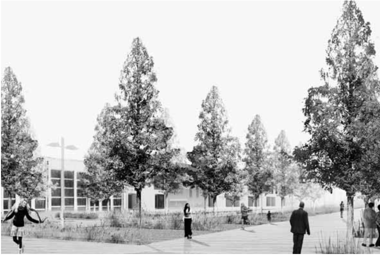
Bureau Bas Smets et 360 Architecten, revalorisation du centre du village d'Ingelmunster (Flandre-Occidentale), perspective, 5 ha, 2007.

Un autre élément fondamental dans l'orientation internationale de Bas Smets est son association, sept ans durant, avec le célèbre bureau Michel Desvigne Paysagistes à Paris. Il y était responsable de projets prestigieux à l'étranger, souvent en collaboration avec des cabinets d'architectes réputés. Ainsi a-t-il dessiné une place, entre le nouveau théâtre réalisé par l' Office for Metropolitan Architecture (OMA) et la salle d'opéra conçue par Foster & Partners pour le Centre for Performing Arts de Dallas, aux États-Unis, le Park Draai Eechelen sur le plateau du Kirchberg à Luxembourg, en collaboration avec I.M. Pei, l'architecte de la pyramide en verre du Louvre à Paris, et l' Almere Waterfront , une place du nouveau centre-ville d'Almere (province de Flevoland aux Pays-Bas), en collaboration avec l'OMA et l'agence japonaise Sejima And Nishizawa And Associates (SANAA) . En Flandre, il a notamment réalisé durant cette période le Rabotpark , près du nouveau palais de justice de Gand 1 , et deux jardins d'eau à l'intérieur de ce même palais de justice, l'aménagement extérieur de l'Hôpital militaire et les espaces verts du quartier Het Eilandje (La Petite Île) à Anvers ainsi que la réhabilitation des berges de la Vieille Lys à Courtrai (Flandre-Occidentale).