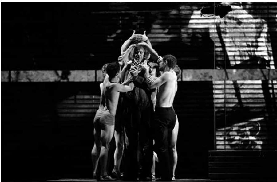
Scène de Das Rheingold , première partie de L'Anneau du Nibelung , Teatro alla Scala de Milan, mai 2010, photo M. Brescia.

le centre de son récit. Il pense ses histoires en images, il développe son intrigue à partir d'une dramaturgie visuelle. En d'autres mots, la projection d'images n'est pas un ajout marginal, elle crée le point où ses productions théâtrales se nouent et se dénouent.