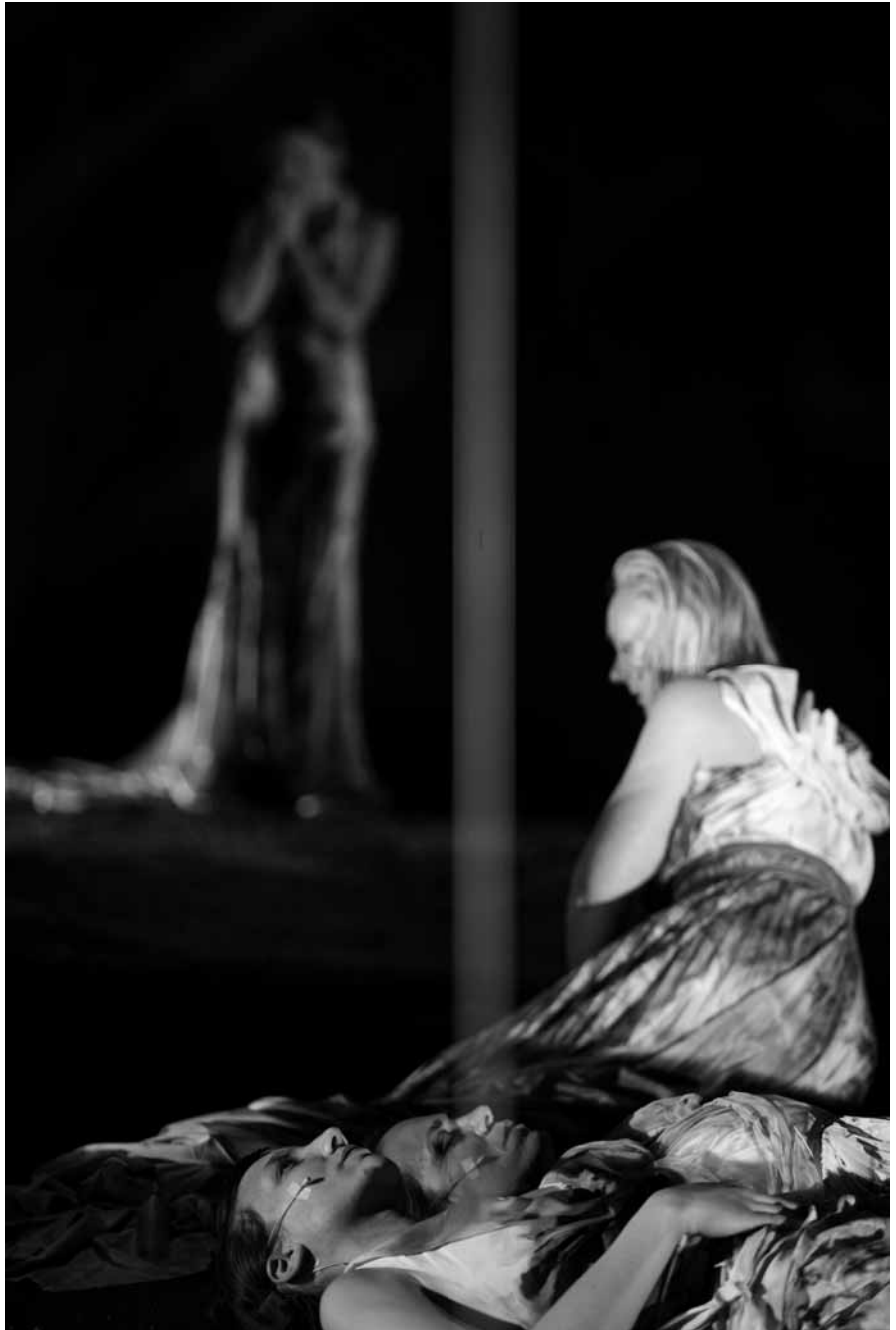
Scène d'Atropa. La Vengeance de la paix , dernier volet du «Triptyque du pouvoir», photo K. Broos.